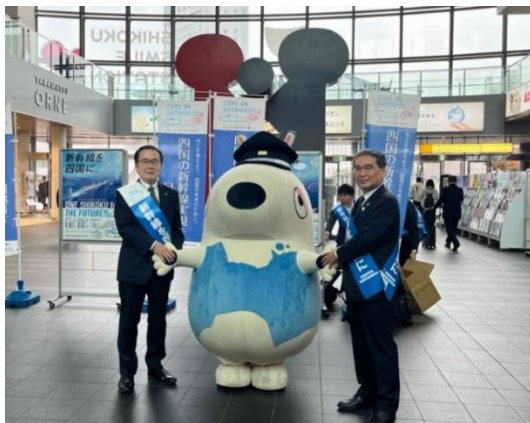
署名協力の呼びかけを実施 (2024年11月15日)