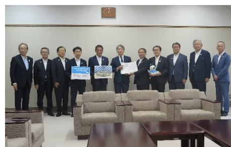
【財務省】 新川 浩嗣 事務次官