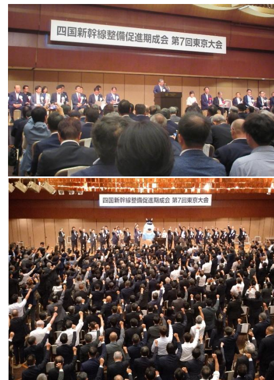
東京大会の様子 (2025年8月21日)