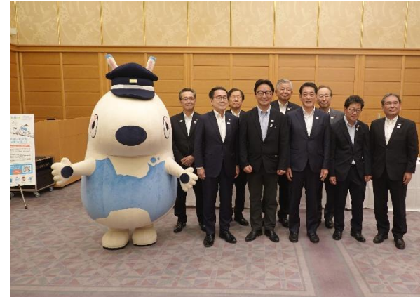
四国の新幹線早期実現に向けた 署名活動の中間発表を実施 (2025年6月4日)