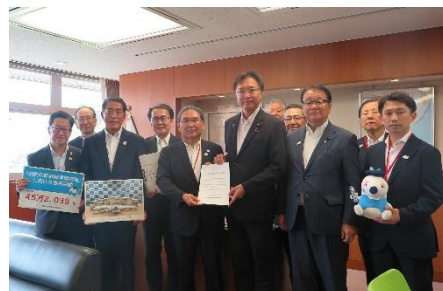
【国土交通省】 国定 勇人 国土交通大臣政務官 (当時)