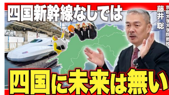
動画サムネイル（イメージ）