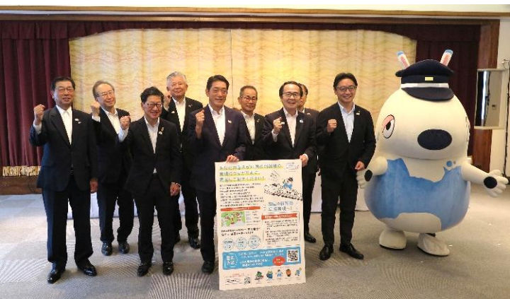
四国の新幹線早期実現に向けた 署名活動の開始を宣言 (2024年6月4日)