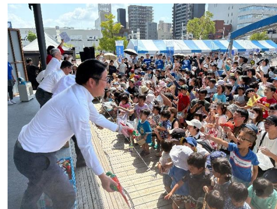
「四国に新幹線を夏まつり」の実施の様子