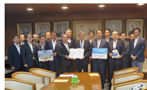
【自民党本部】 森山 裕 幹事長 (当時)