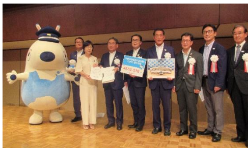
【自民党整備新幹線等 鉄道調査会】 稲田 朋美 会長