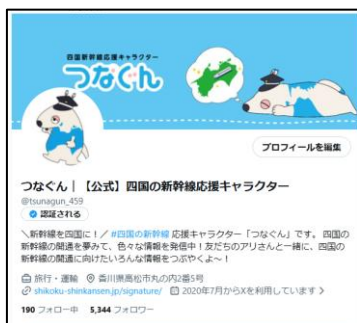
X (旧Twitter) アカウント